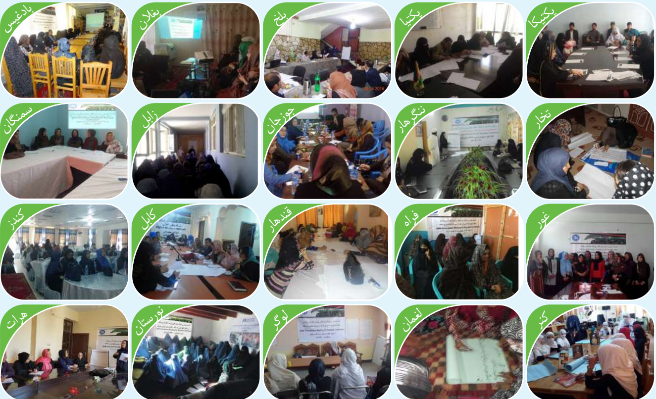
تدویر کنفرانس مطبوعاتی جهت نشر سند موقف زنان برای کنفرانس بروکسل در کابل و هفت زون کشور