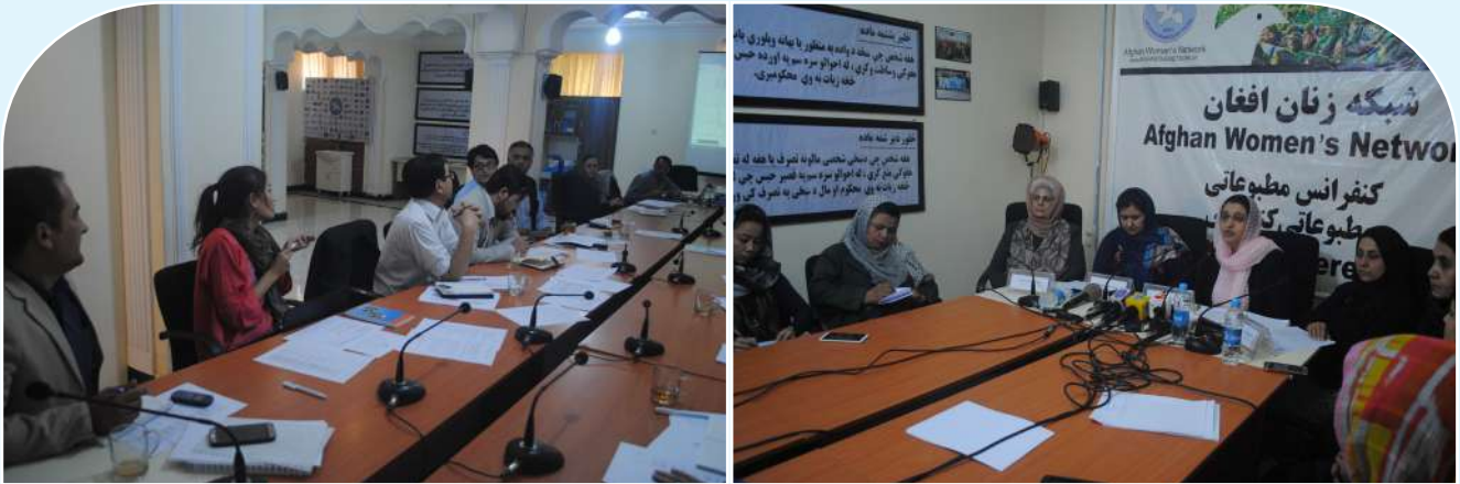
تدویر کنفرانس مطبوعاتی جهت نشر سند موقف زنان برای کنفرانس بروکسل در کابل و هفت زون کشور انتخاب کمیته تخنیک و تدویر مجالس هماهنگی این کمیته جهت نهایی ساختن شاخص ها