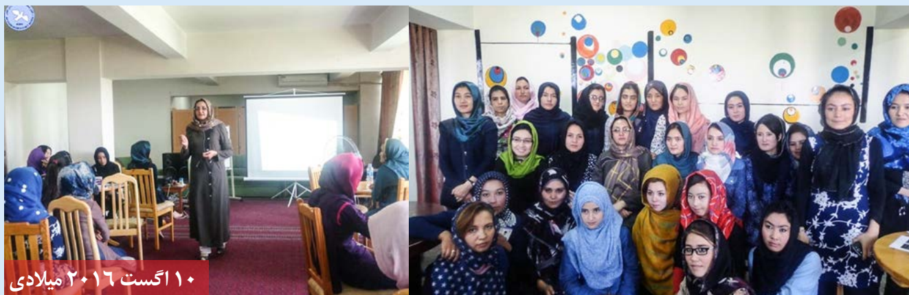
۱۰ اگست ۲۰۱۶ میلادی

در سطوح رهبری و نیز رهبری زنان از دیدگاه اسلام مورد بحث قرار گرفت؛ که در اخیر اشتراک کنندگان از همکاری شبکه زنان افغان جهت پیشبرد برنامه آموزشی اظهار سپاس و قدردانی نمودند.