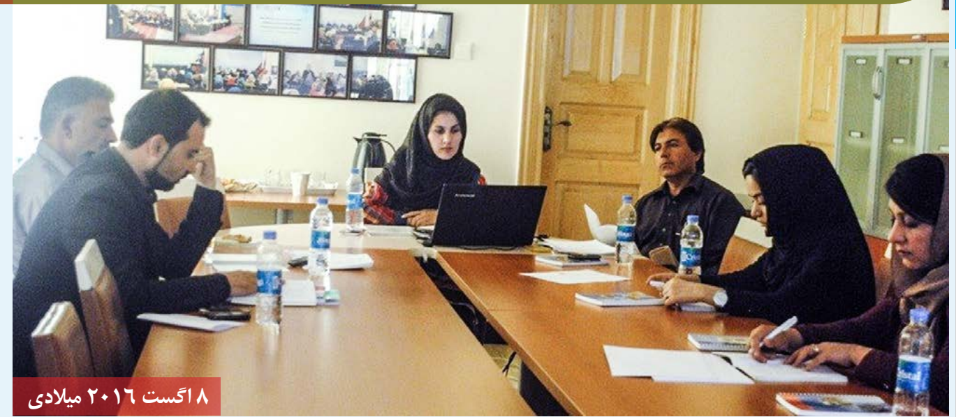
۸ اگست ۲۰۱۶ میلادی

جلسه کمیته حقوق دانان در رابطه به خلاها و نواقص قانون کار به منظور پیشنهاد تعدیل آن به شورای وزیران در دفتر مرکزی شبکه زنان افغان برگزار گردید. در این جلسه نمایندگان نهادهای جامعه مدنی و بخش های قضا و سارنوالی اشتراک ورزیده، و روی تعدیل مواد قانون کار افغانستان که در سال ۱۳۸۵ هجری تعدیل گردیده بود، ولی بعضی از مواد این قانون مشکلات را در قبال داشت و حقوق زنان و نو جوانان در بعضی از مواد آن یا نقض گردیده بود و یا هم وجود نداشت، ازینرو برای حل این مشکل تیم تخنیکي اصلاح قوانین روی تعدادی از مواد آن نظرپردازی و تصمیمات را اتخاذ نمودند، تا برای شامل سازی آن به وزارت کار و امور اجتماعی تسلیم نمایند.