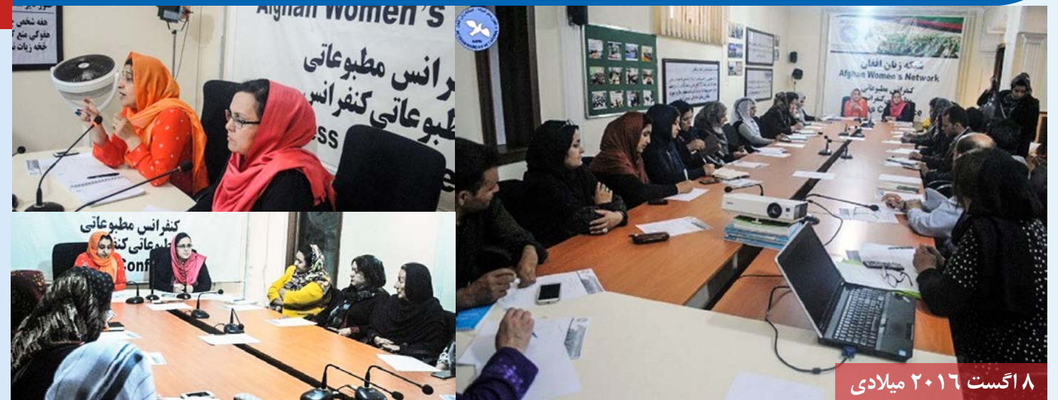
۸ اگست ۲۰۱۶ میلادی

مجلس ماهانه هماهنگی شبکه زنان افغان با حضور رئیس و اعضای هیئت مدیره شبکه زنان افغان، مسئولین و نمایندگان نهادهای عضو، اعضای انفرادی و ارگان های همکار، در دفتر مرکزی این شبکه تدویر یافت.