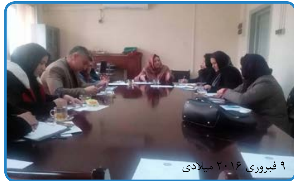
۹ فبروری ۲۰۱۶ میلادی