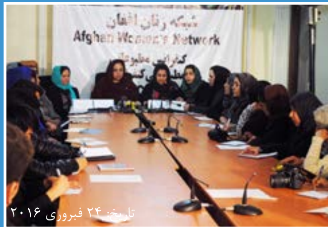
۲۴ فبروری ۲۰۱۶ میلادی