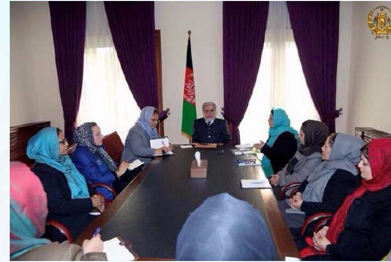
۶ دسمبر ۲۰۱۵ میلادی

در مسیر کمپاین ۱۶ روزه منع خشونت علیه زنان، رهبریت شبکه زنان افغان همراه با نمایندگان وزارت امور زنان، اعضای انات پارلمان (ولسی جرگه و مشرانو جرگه) و نمایندگان کمیسیون مستقل حقوق بشر افغانستان با جناب محترم داکتر عبدالله رییس اجرائیه جمهوری اسلامی افغانستان دیدار کردند. در این دیدار روی قضایای اخیر خشونت علیه زنان و پیگیری قضیه فرخنده بحث صورت گرفت. در پایان جناب محترم مکررا تاکید بر تعهدات خویش در قبال حمایت از درخواست زنان نموده، و نیز وعده سپرد