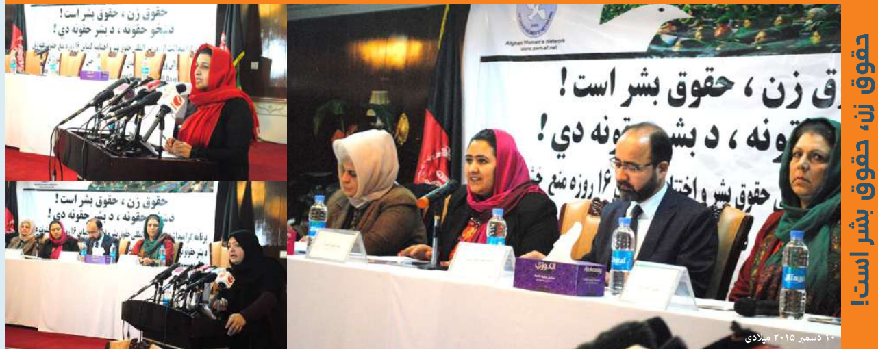
حقوق زن، حقوق بشر است!