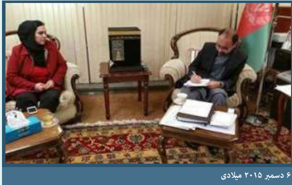
۶ دسمبر ۲۰۱۵ میلادی