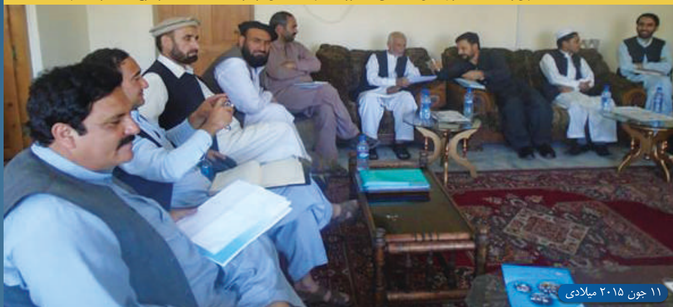
۱۱ جون ۲۰۱۵ میلادی

در ارتباط به پیام و فراخوان کنفرانس ملی گفتگو مردم افغانستان پیرامون صلح کابل، نشست تعدادی از نهادهای فعال مدنی به شمول دفتر ساحوی شبکه زنان افغان در ولایت ننگرهار در دفتر کمیسیون مستقل حقوق بشر زون شرق صورت گرفت. این نشست به هدف نقاط کلیدی بحران و منازعه به شمول نقض موازین حقوق بشری و ایجاد یک پروسه فراگیر برای صلح در افغانستان تدویر یافت، در نتیجه این نشست دفتر ساحوی شبکه زنان افغان مقیم ولایت ننگرهار، اوویک و مرکز فرهنگی جامعه مدنی مسوولیت شریک ساختن موضوعات را همراه با والی ننگرهار، شورای ولایتی، شورای ولایتی صلح، و دیگر ارگان های زیربند برعهده گرفتند که در آینده در نظر است همراهی شورای ولایتی ننگرهار و شورای صلح این ولایت به ارتباط موضوع دیدار صورت گیرد.