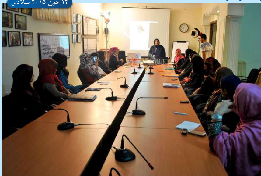
۱۴ جون ۲۰۱۵ میلادی

رهبران جوان دومین دور از برنامه رهبری زنان جوان که از طرف شبکه زنان افغان به همکاری مالی کشور استرالیا به راه انداخته شده است، نخستین روز آموزشی خویش را با تجلیل از روز مادر آغاز کردند. در محفلی که بدین مناسبت برگزار شد علاوه از ۱۵ تن رهبر جوان این دور، و دور نخست از چند تن مادران نیز دعوت به عمل آمد. در این برنامه تعدادی از رهبران هر دو دور به نمایندگی دیگران سخنرانی نموده، مقاله ها و اشعار خویش را به وصف مادر شریک ساختند. و با تقدیم تحایف برای مادران حاضر در محفل این روز را تجلیل کردند.