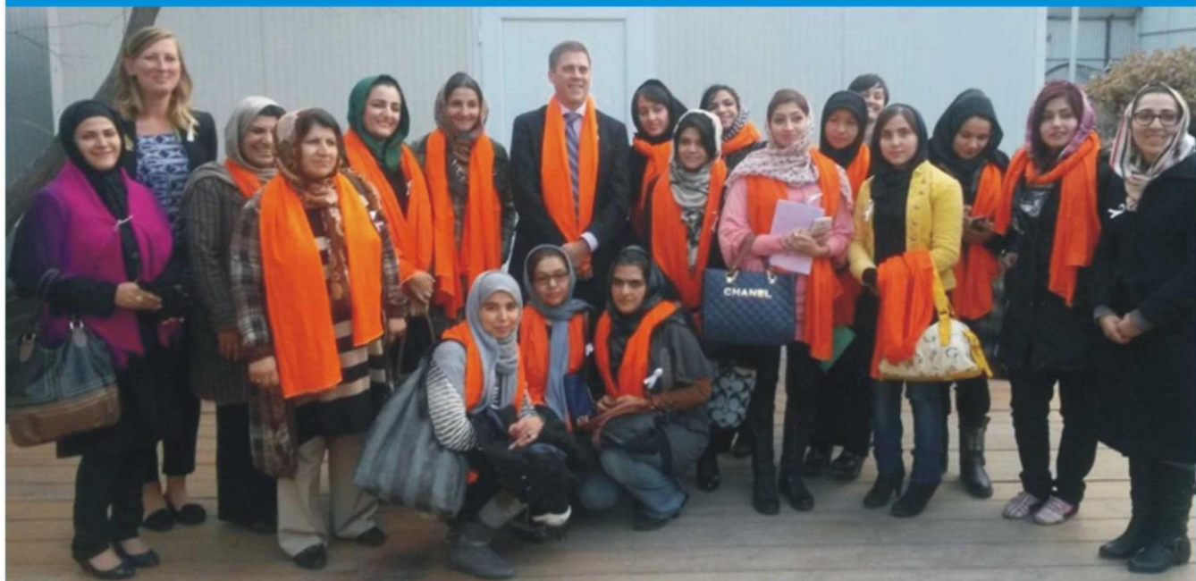
تصویری از سفیر آسترلیا در کابل با رهبران جوان