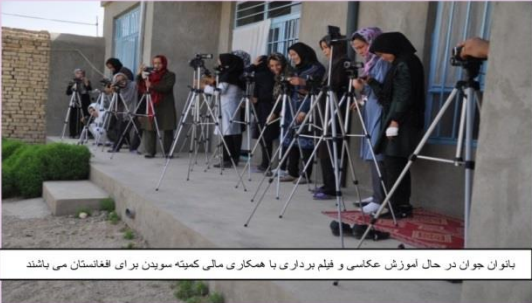
بانوان جوان در حال آموزش عکاسی و فیلم برداری با همکاری مالی کمیته سویدن برای افغانستان می باشند

مؤسسه خدماتی و فرهنگی طلوع در سال ۲۰۰۳ در شهر کابل توسط عده ای از افراد با تجربه و تحصیل کرده با درک ناهنجاری ها از وضعیت اجتماعی و یاری رساندن به مردم آسیب دیده و بی بضاعت افغانستان تأسیس و در وزارت پلان آن زمان ثبت گردید که بعداً در سال ۲۰۰۵ میلادی در وزارت اقتصاد ثبت مجدد گردید.